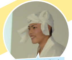
大島の自然を活用した ツアーをつくりたい！